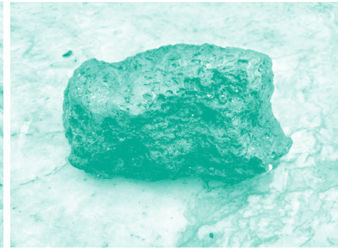
Hélène, ce caillou aussi est l'original de lui-même.