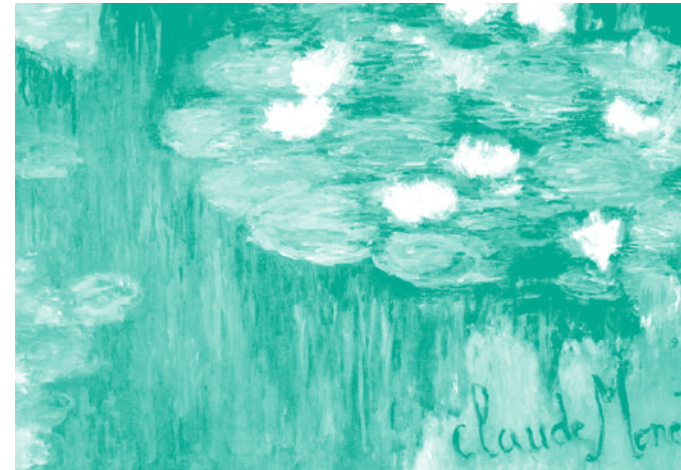
Hélène, ce tableau n'est pas l'original des Nymphéas , j'en suis l'auteur, et je ne suis pas Claude Monet.